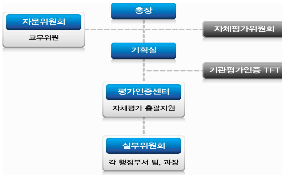
[그림 I-1] 자체평가 조직체계